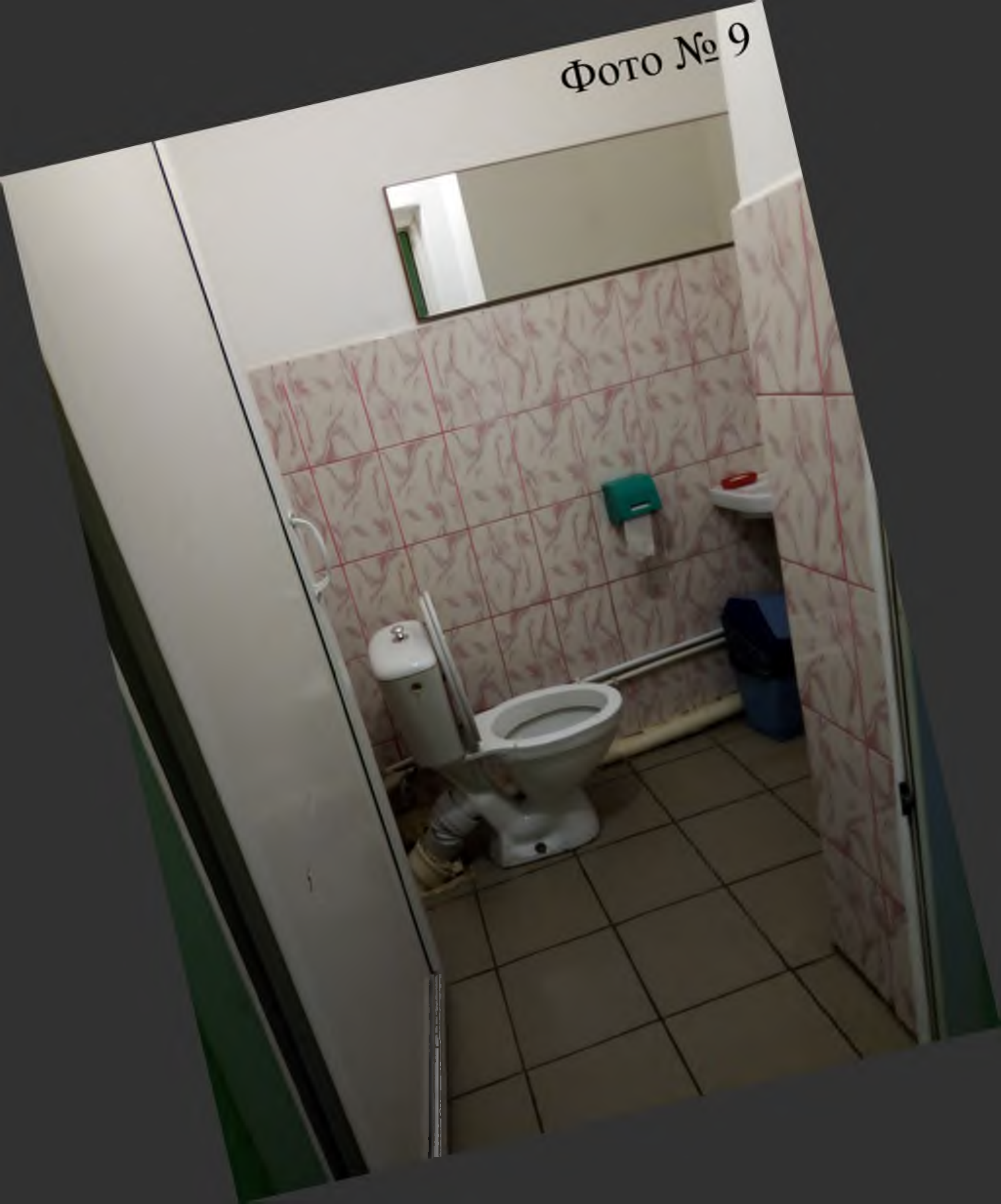
ФОТО № 9