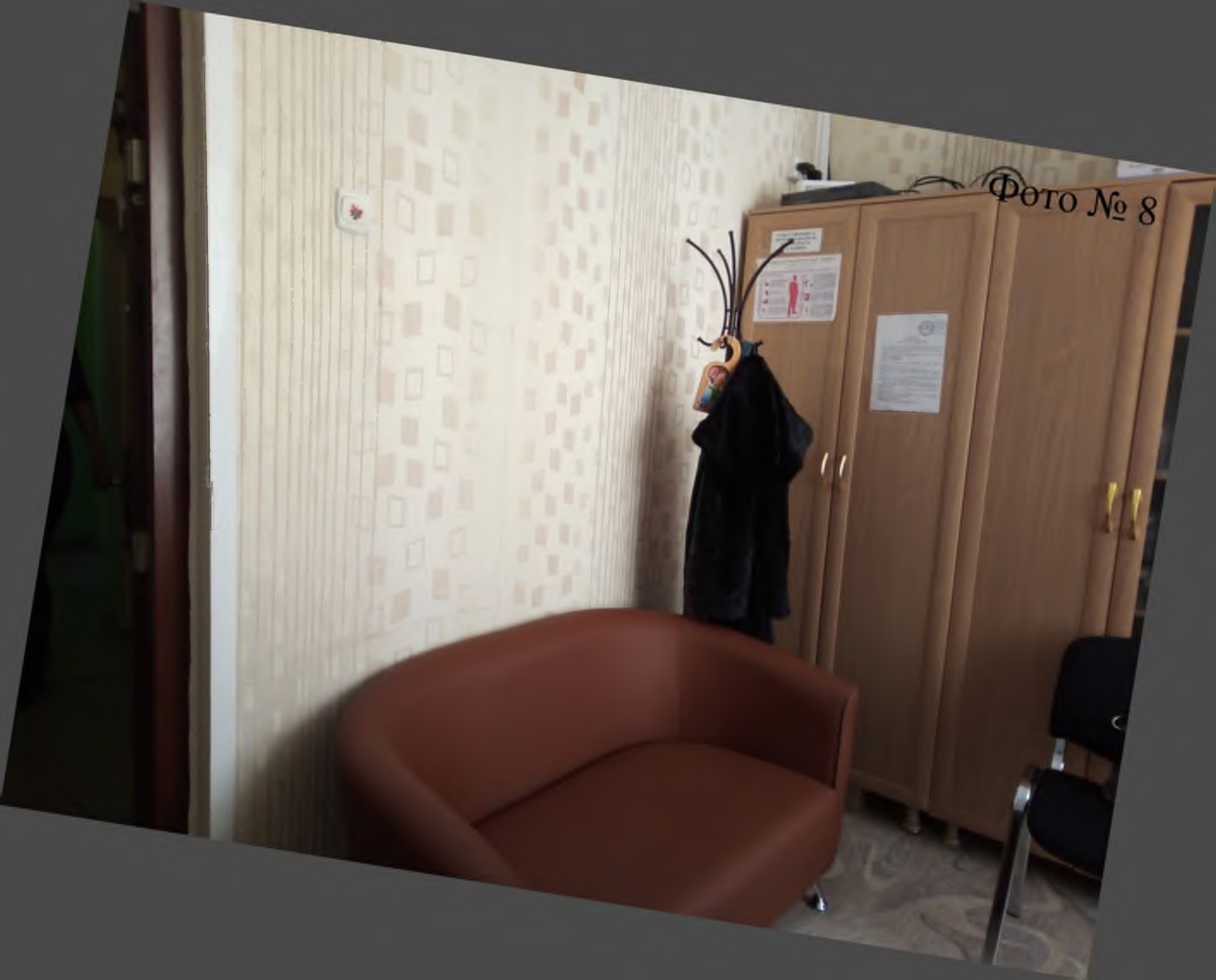
ФОТО № 8